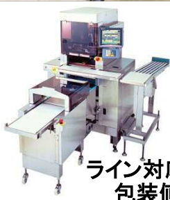
ライン対応型自動 包装値付機

製造者 株式会社インダ 075-751-1686 京都市左京区聖護院山王町4-4番地