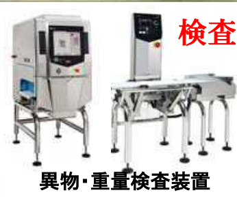
異物・重量検査装置