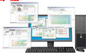
食品管理・支援システム