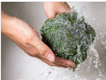
電解次亜水生成機